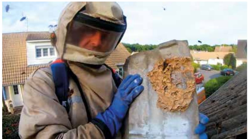
▲ Une intervention en ville, par un professionnel avec le matériel adapté, sur un nid de frelons asiatiques situé sous toiture.

Prenez une bouteille en plastique vide, faites trois trous de 6 mm à quelques centimètres du goulot et versez 3 à 4 centimètres d'un mélange de grenadine, bien