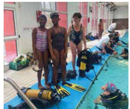
▲ Réservée aux femmes, l'initiation à la plongée du 8 mars permet de prendre, ou reprendre, confiance en soi.