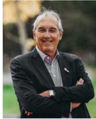
Gilles Battail Maire de Dammarie-lès-Lys Conseiller régional