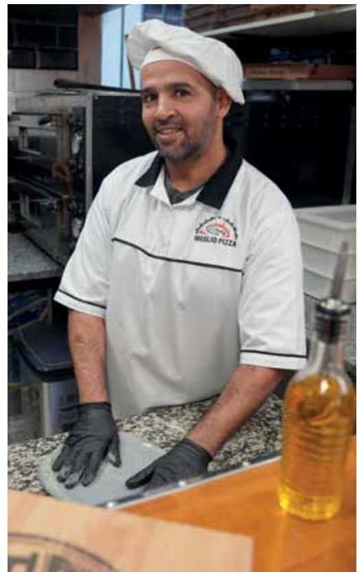
▲ C'est derrière son comptoir, devant ses clients, que le chef de Meglio Pizza prépare ses savoureuses pâtes à pizza.