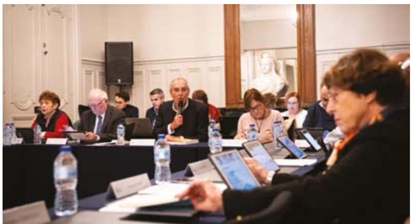
▲ Le conseil municipal se tient dorénavant au Château Soubiran, 170 Avenue Henri Barbusse. Le public est toujours invité à assister aux séances.

redéfinir le périmètre du projet. Kaufman & Broad Homes prévoit la réalisation d'un ensemble immobilier de 146 logements neufs et de 2 locaux d'activité. Le foncier restant, soit 1818 m 2 situé derrière l'IRM demeurera propriété de la Ville afin de conserver cet espace vert boisé, qui par ailleurs est identifié dans une Orientation d'Aménagement et de Programmation « centre-ville », comme une parcelle dans laquelle une liaison douce pourrait être réalisée. Le conseil municipal a voté la désaffectation et le déclassement du domaine public communal de l'emprise foncière de 7 418 m 2 et la cession de ce terrain à la Société Kaufman & Broad Homes.