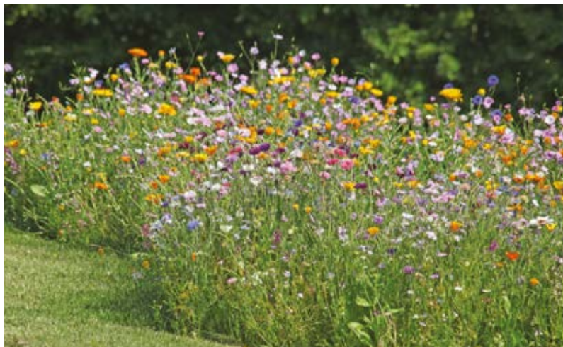
▲ Les Dammariens pourront profiter du labyrinthe en fleurs dès le printemps prochain.

de la ferme pédagogique, il intégrera également un refuge à coccinelles, une ruche pour insectes pollinisateurs et un nichoir à oiseaux. L'occasion pour les promeneurs curieux d'observer la faune et la flore et ainsi de mieux comprendre la biodiversité grâce aux panneaux pédagogiques installés sur le parcours du labyrinthe. Sur le plan de l'entretien, ce nouvel espace bénéficiera de quatre mois de prairie en fleurs (deux fauches par an seront effectuées par les services de la Ville), un regarnissage chaque année à l'automne, sans oublier la tonte des allées réalisée toutes les trois semaines. « Contrairement à ce que certains peuvent penser, nous ne laissons pas ces espaces à l'abandon, nous les entretenons de manière raisonnée tout en assurant la sécurité des habitants grâce à une tonte régulière des allées et des abords » confirme Victor Guérard, élu délégué aux Espaces publics. Côté planning, les Dammariens pourront profiter du labyrinthe en fleurs dès le printemps. En attendant, ils auront l'opportunité d'observer l'évolution des graines et le développement des plantes dès que les semis seront plantés avant les gelées hivernales.